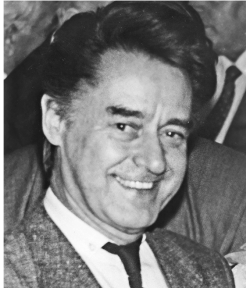
А. Д. Дементьев

Сын агронома. Школьником занимался в лит. кружке, писал стихи. Учился в Калининском педагогическом ин-те. По совету С. Наровчатова перешел в Лит. ин-т им. М. Горького, занимался в семинаре М. Луконина, затем Е. Долматовского (окончил в 1952). Вер-