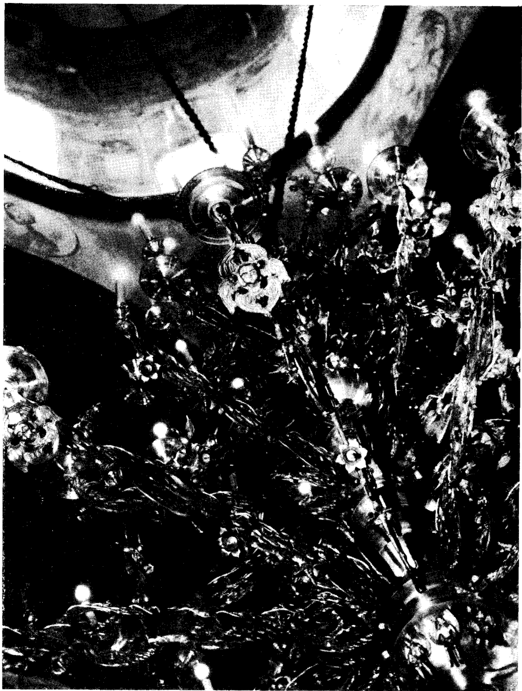
Рис. 2. Годуновское паникадило из Софийского собора в Новгороде. Деталь.