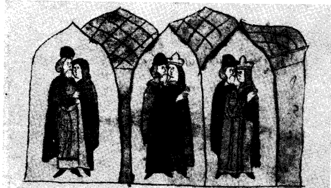
Лондонский лицевой список «Сказания о Мамаевом побоище». 15-я миниатюра, л. 14. (Рис. 3).

И повѣда единоу митропохитѣ еретиѣмъ стѣи стареца . и кѣко бл҃гвѣнне дѣста ѣмъ . и всемъ во ѣмъ егѣ . ѡручѣнѣ повелѣ ѣмъ хранити словѣ бл҃г рече ѣмъ стѣи стареца вергѣи неповѣда ни ко мѣже . и прѣспѣвѣши четвертѣсѣ . а н҃густа въ іѣз напѣмъ стѣиго ѡщѣпѣи мина ѡхрѣднѣна . и во хотѣ и зыти противѣ егѣжѣи царѣ . и нѣмъ ачѣи ди митрей и нѣмъ овѣи поѣ братѣа своеѣ колѣдѣи мѣра