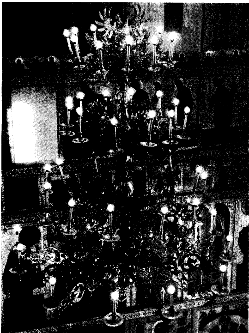
Рис. 1. Годуновское паникадило из Софийского собора в Новгороде. Общий вид.