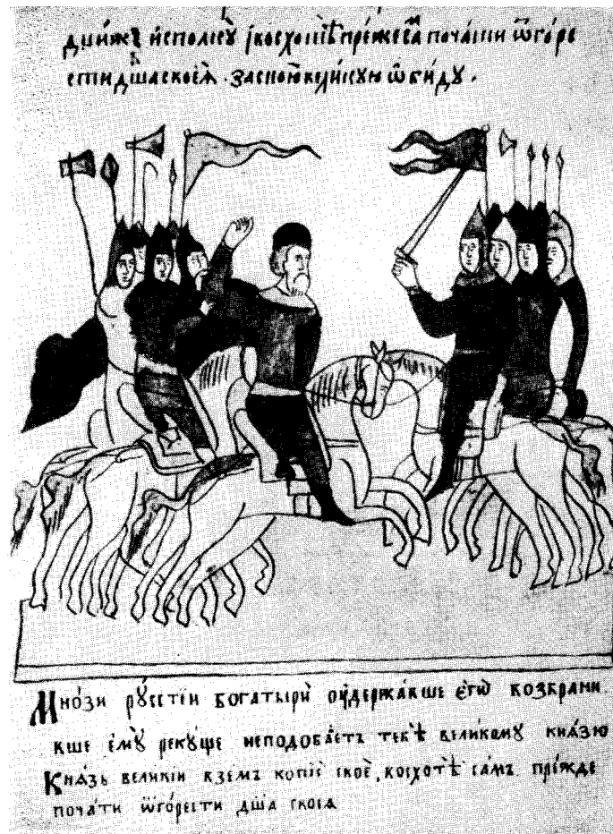
Лондонский лицевой список «Сказания о Мамаевом побоище». 25-я миниатюра, л. 21. (Рис. 7).

Дийше исполитъ (кочоу) иишюиде паразѣ снѣи снѣи снѣи снѣи снѣи снѣи снѣи снѣи снѣи снѣи